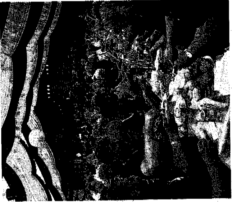
Die neuen Bortfelder Majestäten mit ihren Festscheiben. Beim Königsfrühstück war das Festzelt mit mehr als 1000 Gästen rappellvoll.